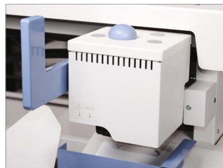
Aplicador de pegamento fácil y seguro

Información del producto a partir de enero de 2018 y está sujeta a cambios sin previo aviso