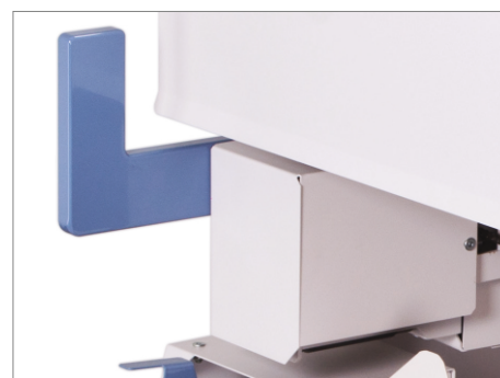
Nuevo sistema de fresado PGO Microcut